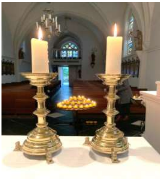
gedachtenislichtjes branden in onze kerk

Ook het kerkhof werd druk bezocht. De vele graflichten en bloemen die daar geplaatst waren, getuigden daarvan. Voor de vrijwilligers van onze kerkhofploeg was er een bijzonder compliment in de vorm van een dankbericht per mail over het uitstekende onderhoud.